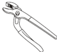
Groove join pliers