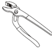
Groove join pliers